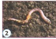
2 Ver de terre