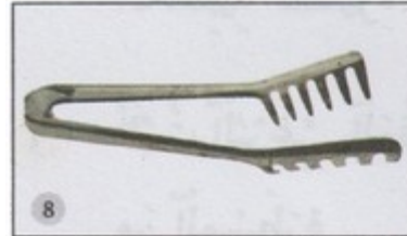
pince de cuisine