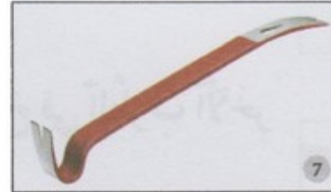
pied de biche (arrache clou)