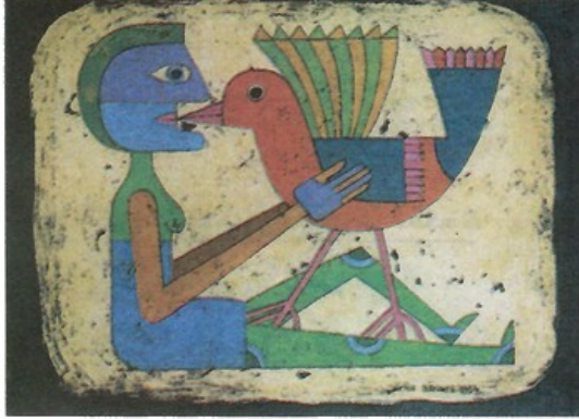
تلقين الحرية. لوحة للفنان فيكتور براونر 1954. Victor Brauner.

منذ كتابه «عقم المذهب التاريخي»، نصّب كارل بوبر نفسه منتقداً للتحتمية في مجال العلوم الإنسانية ومناصراً للنزعة الاحتمية. ولكنه لا يذهب إلى حد اعتبار الحرية الإنسانية معطى مطلقاً بل يرى أنها خاضعة للمحددات والقواعد المتوارثة في مجال من المجالات وكذا للسياقات والظروف المحيطة.