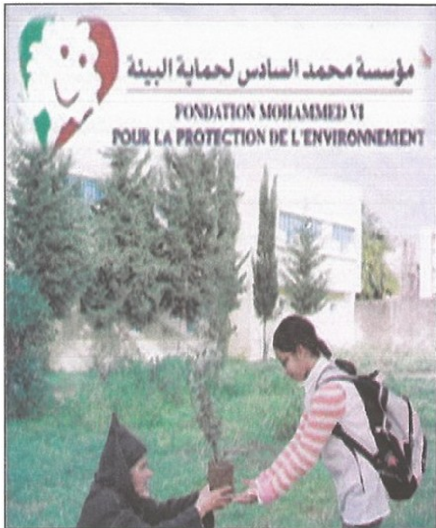
الوثيقة 3 : ملصق (نصائح للمساهمة في حماية البيئة)