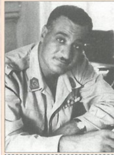
جمال عبد الناصر

«إن حكومة مصر وحكومة المملكة المتحدة لبريطانيا العظمى وشمال إيرلندا، إذ ترغبان في إقامة العلاقات المصرية الإنجليزية على أساس جديد من التفاهم والصداقة الوطيدة قد اتفقتا على ما يلي: - المادة 1: تجلو قوات صاحبة الجلالة جلاء تاماً عن الأراضي المصرية [...] خلال فترة عشرين شهراً من تاريخ التوقيع على الاتفاق الحالي. - المادة 2: تعلن حكومة المملكة المتحدة انقضاء معاهدة التحالف الموقع عليها في لندن في السادس والعشرين من شهر أغسطس سنة 1936م [...] وجميع ما تفرع عنها من اتفاقات أخرى [...]. - المادة 8: تقر الحكومتان المتعاقدتان أن قناة السويس البحرية، وهي جزء لا يتجزأ من مصر وطريق مائي له أهميته الدولية من النواحي الاقتصادية والتجارية والاستراتيجية، وتعربان عن تصميمهما على احترام الاتفاقية التي تكفل حرية الملاحة في القناة الموقع عليها في القسطنطينية في التاسع والعشرين من شهر أكتوبر 1888م».