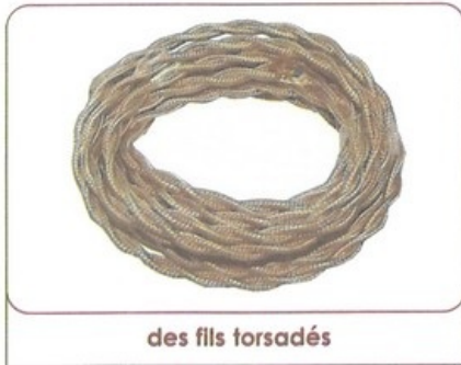
des fils torsadés