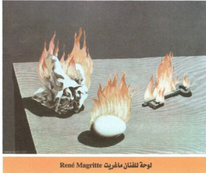
لوحة للفنان ماغريت René Magritte