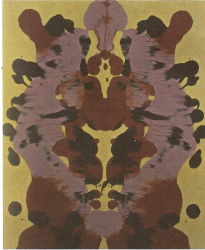
اختبار رورشاخ، لوحة للفنان أندي وارول (Andy Warhol) 1984