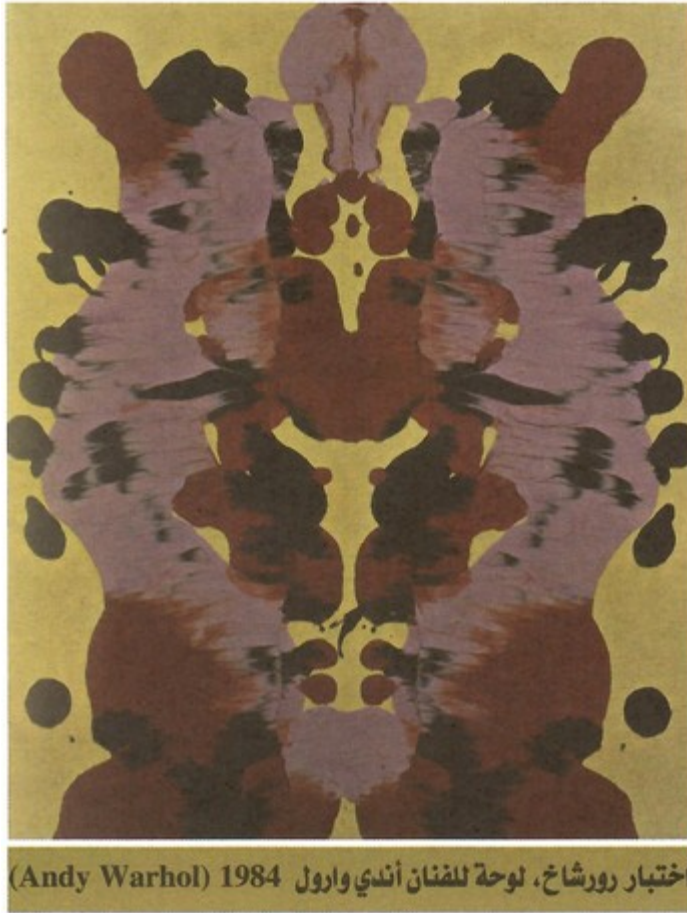
اختبار رورشاخ، لوحة للفنان أندي وارول (Andy Warhol) 1984