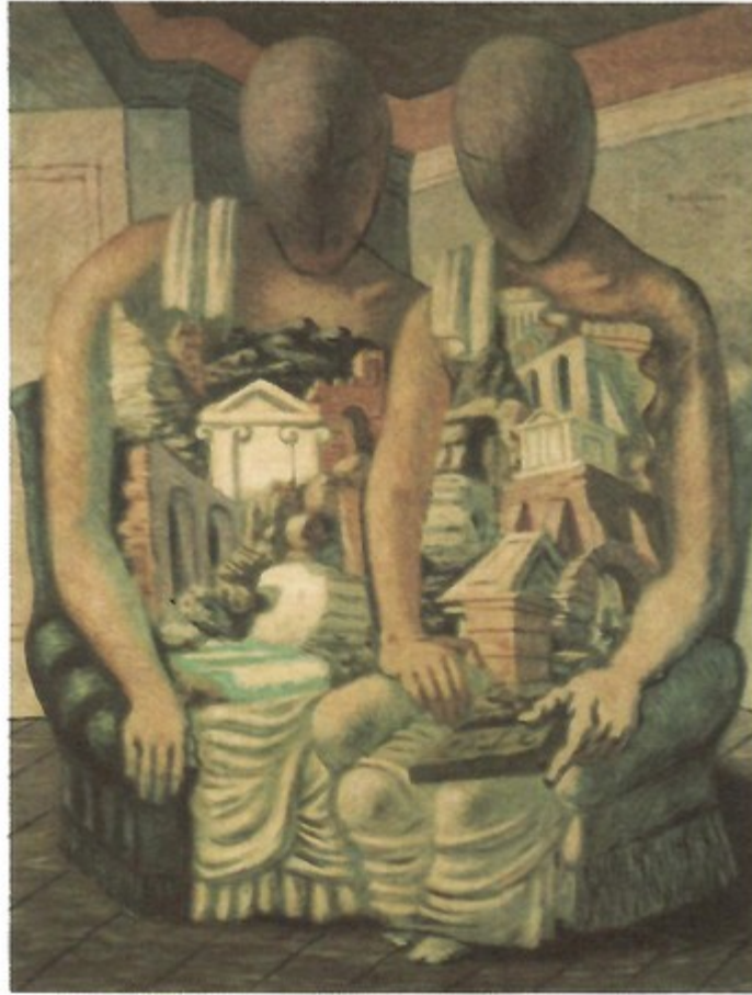
الأركيولوجي لوحة للفنان دوشيريكو