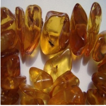
Insecte piégés dans de l'ambre