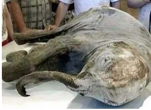
Bébé de mammouth âgé de 40000 ans découvert en Sibérie