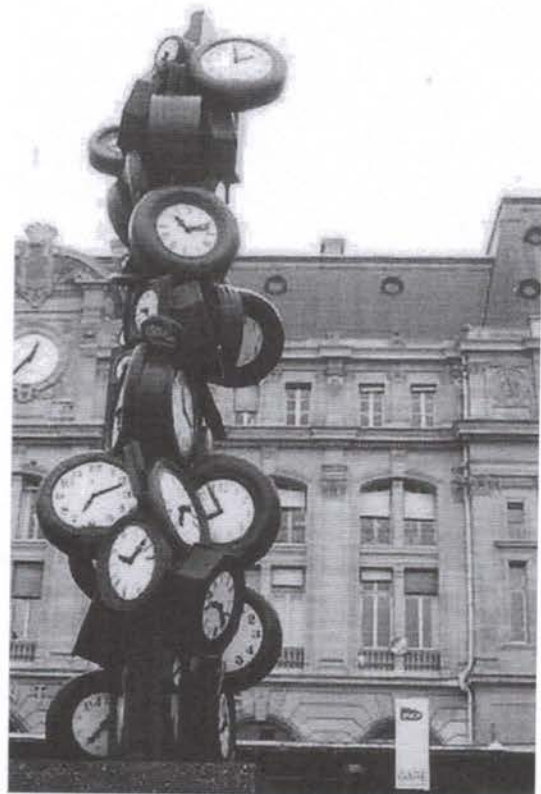
Lefèvre Daniel, L'horloge de la gare Saint-Lazare , 2011.