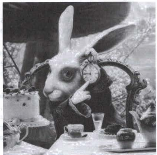
Lewis Carroll, Le lapin d'Alice au pays des merveilles (1869), Disney, 2010.

Douglas Adams, Le Guide du voyageur galactique , 1979.