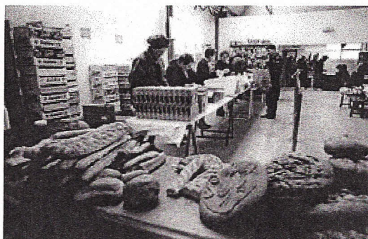
Distribution d'aide alimentaire par des bénévoles des « Restos du cœur ».

De fait, au cours de la campagne pour l'élection présidentielle de 2007, les deux principaux candidats promettaient une refonte du système actuel et l'instauration du RSA 1 .