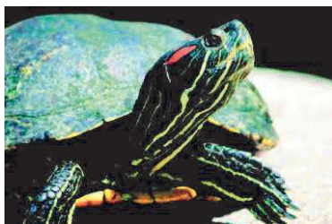
Tortue de Floride

Une espèce invasive (aussi appelée espèce envahissante) est une espèce soit végétale soit animale introduite, dans un nouveau milieu, volontairement ou non par l'humain et qui devient nuisible pour les espèces locales. Elle est originaire d'un pays étranger et menace la biodiversité locale et l'environnement là où elle s'est implantée.