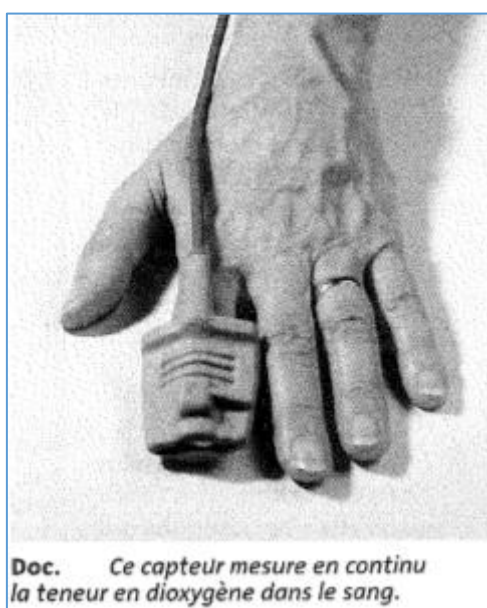
Doc. Ce capteur mesure en continu la teneur en dioxygène dans le sang.

Si l'échantillon à analyser existe en faible quantité, on choisit une méthode non destructive. Par contre si l'échantillon à analyser est disponible en grande quantité on peut utiliser la méthode destructive.