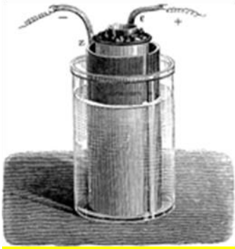
عمود دانيل : زنك – نحاس

و- كيف يركب الفولط متر لتحديد قطبية العمود و القوة الكهرمحركة للعمود ؟