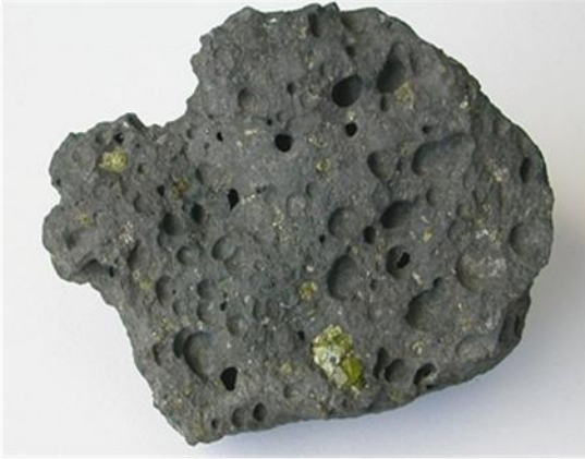
عينة من صخرة البازلت

1- ملاحظة عينات من صخرتي البازلت والكرانيت بالعين المجردة.