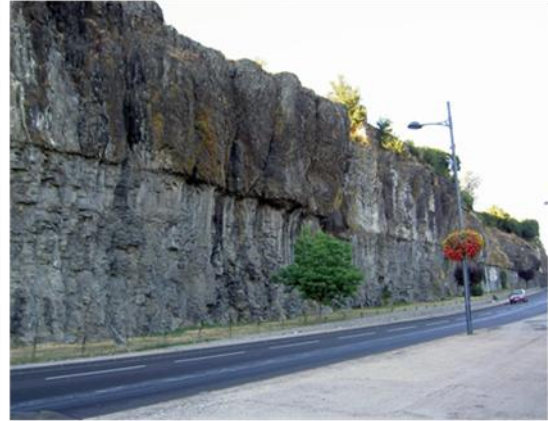
منظر عام لصخور البازلت

صخرة داكنة، صلبة خشنة كثيفة. تحتوي على بلورات كبيرة (الأوليفين والبيروكسن) وعلى عجين.